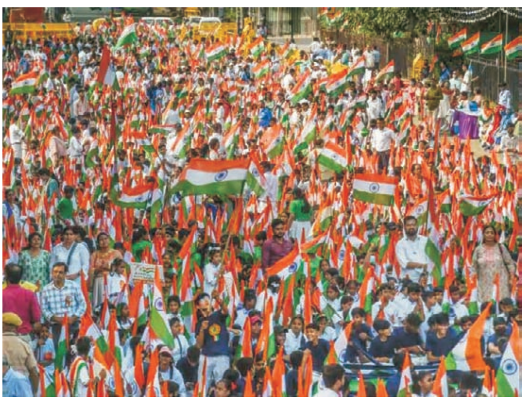
gov.in) દ્વારા પણ રાષ્ટ્રધ્વજ ખરીદી શકાય છે. દેશના લોકો તેમના ઘરો અને આના દ્વારા દરેક ઘર તિરંગા અભિયાનનો સત્તાન ભાગ બની શકે છે. લોકોના હૃદયમાં દેશભક્તિની ભાવના અને ભારતની યાત્રા માટે ગવર્નની ભાવના જગાડવા માટે સરકાર

દ્વારા ગયા વર્ષે હર ઘર તિરંગા અભિયાન શરૂ કરવામાં આવ્યું હતું. ૨૦૨૨ માં આ ઝુંબેશ ખૂબ જ સફળ રહી, જ્યાં ૨૩ કરોડ પૈરિવારોએ તેમના ઘરે તિરંગો ફરકાવ્યો અને ૬ કરોડ લોકોએ હર ઘર તિરંગા (HGT) વેબસાઈટ પર સેફ્ટી અપલોડ કરી. આ વર્ષે પણ સરકાર ૧૩-૧૫ ઓગસ્ટ, ૨૦૨૩ વચ્ચે 'હર ઘર તિરંગા અભિયાન'નું આયોજન કરી રહી છે. દેશમાં ૧.૬ લાખ પોસ્ટ ઓફિસમાં વિશાળ નેટવર્કનો લાભ લેવા અને અભિયાન અંતર્ગત દેશની તમામ પોસ્ટ ઓફિસોમાં ભારતીય ધ્વજનું વેચાણ કરવાનો નિર્ણય લેવામાં આવ્યો છે. ઈન્ડિયા પોસ્ટની ૧.૬ લાખ પોસ્ટ ઓફિસમાં તિરંગા ધ્વજનું વેચાણ ટૂંક સમયમાં શરૂ થશે. લોકો તેમની નજીકની પોસ્ટ ઓફિસમાં જઈને ધ્વજ ખરીદી શકે છે. આ સિવાય ટપાલ વિભાગની ઈ-પોસ્ટ ઓફિસ (www.epostoffice.gov.in) દ્વારા પણ રાષ્ટ્રધ્વજ ખરીદી શકાય છે. દેશના લોકો તેમના ઘરો અને આના દ્વારા દરેક ઘર તિરંગા અભિયાનનો સત્તાન ભાગ બની શકે છે. લોકોના હૃદયમાં દેશભક્તિની ભાવના અને ભારતની યાત્રા માટે ગવર્નની ભાવના જગાડવા માટે સરકાર