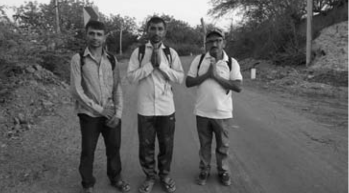
આણંદપર(યશ) માના નોરતા(નવરાત્રી) વર્ષમાં બે વખત આવે છે. આશો મહિનામાં લીલા નોર્ટસ અને ચૈત્ર મહિનામાં સુકા નોરતા આવતા હોય છે. આસો મહિનામાં માતાના મઠ માતાજીના દર્શન કરવા લોકો પગપાળા અવિરત પણે જતા હોય છે. એવી જ રીતે ચૈત્ર મહિનામાં નવરાત્રી નિમિત્તે પદયાત્રીઓ સારા પ્રમાણમાં પગપાળા જતા હોય છે. ચૈત્ર મહિનામાં પણ અમુક જગ્યાએ પદયાત્રીઓની સેવા માટે સ્ટોલ ઉભા કરવામાં આવતા હોય છે. અને યાત્રાળુઓ પગપાળા જોવા મળી રહ્યા છે.