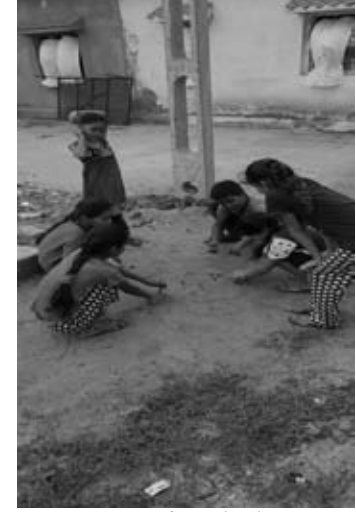
આણંદપર(યશ) મોબાઈલ,ટી.વી.કોમ્યુટર યુગ આવતા બાળકો દ્વારા રમતો રમતો જેવી લખોટી, ભમરડા, ગેલીદંડા (અહીંની ભાષામાં એટા એટી), આસપાસ, સતોડિયા, કબડી,ખો-ખો જેવી અનેક રમતો બાળકો રમતા હતા. આવી રમતો થકી બાળકો શરીરમા સ્થાનિક સાથે તેના વિકાસ સાથે મગજ પણ કસાતું હતું. જયારથી મોબાઈલ આવ્યો અને તેની અંદર જે ગેમો આવતી

અને બાળક આ ગેમો રમવાની શરૂ કરતા શરીરના વિકાસ સાથે નજર પણ ઓછી થવા લાગી અને ગેમના કારણે અભ્યાસ પણ મોટી અસર પડી રહી હતી. તેમજ બાળક આવી ગેમો થકી અવગે રસ્તે ચડી જે ગેમમાં હોય એવું કરવા જાતું હોય છે. જેથી કરીને બાળકોને જીવ ખોવાનો વખત પણ આવ્યા છે. હાલ બાળકો આવી ગેમો મુકી જુની રમતો તરફ આગળ વધ્યા છે. શાળાએથી બાળકો ઘરે આવી મોબાઈલના દરરોજ ઉપયોગ થકી બાળકો હવે થાક્યા હોય એવું લાગી રહ્યું હોય એમ લાગતા બાળકો જે પહેલા જુની રમતો રમતો હતી એ ફરી જુની રમતો તરફ વળ્યા છે. આમ બાળકો જુની રમતો થકી શરીરનો વિકાસ વધશે. આમ ગામડાઓના બાળકો હાલ મોબાઈલને મુકીને જુની રમતો તરફ વળ્યા છે. એવીજ રીતે નખત્રાણા તાલુકાના આણંદપર(યશ) ગામના નાના બાળકો લખોટી વાળી જે જુની રમતોને યાદ કરીને રમી રહ્યા છે. જે જોવા મળી રહી છે.