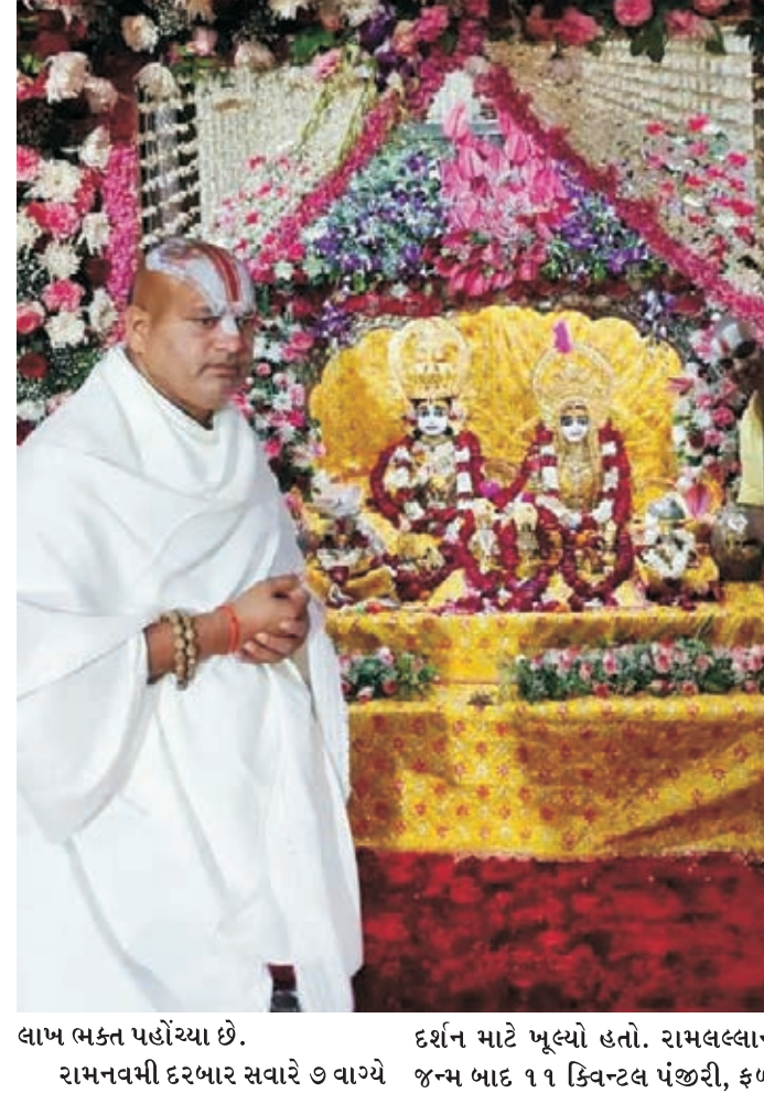
લાખ ભક્ત પહોંચ્યા છે. રામનવમી દરબાર સવારે ૭ વાગ્યે દર્શન માટે ખૂલ્યો હતો. રામલલ્લાના જન્મ બાદ ૧૧ કિલોગ્રામ પંચોટી, ફળો

અને ડ્રાયફ્રૂટ્સનો ભોગ લગાવવામાં આવ્યો હતો. વિવિધ સ્થળોએ રંગોળી કરવામાં આવી હતી. જન્મભૂમિમાં ભગવાનના જન્મ બાદ આરતી કરવામાં આવી હતી. ત્યારબાદ પ્રભુપાટની ગુરુ પૂજા કરવામાં આવી હતી. ત્યારબાદ ૮.૦૦ કલાકે ભગવાન રામચંદ્રના જીવન ચરિત્ર બપોરે ૨ વાગે ફરી ખૂલ્યો. આ પછી અભિવાદન થયું, એટલે કે મંગળ ગીતો ગાવામાં આવશે અને ભક્તો દર્શન કરશે. નેપાળના જનકપુર એટલે કે માતા સીતાના ઘરથી ૫૦૦થી વધુ મિથિલાની સમીઓ પણ અયોધ્યા આયાયાં છો. મિથિલેશનનિદાના શરણના સાંનિધ્યમાં જનકપુરથી આવી છે. આજે અમદાવાદ ઈસ્કોન મંદિરમાં ૨૫ લાખથી વધુ શ્રદ્ધાળુઓએ દર્શનનો લાભ લીધો હતો. રામનવમીની ઉજવણી કરવામાં આવી હતી અને ૨૫ લાખથી વધુ શ્રદ્ધાળુઓએ દર્શનનો લાભ લીધો હતો. રામનવમીની ઉજવણી કરવામાં આવી હતી અને ૨૫ લાખથી વધુ શ્રદ્ધાળુઓએ દર્શનનો લાભ લીધો હતો. રામનવમીની ઉજવણી કરવામાં આવી હતી અને ૨૫ લાખથી વધુ શ્રદ્ધાળુઓએ દર્શનનો લાભ લીધો હતો.