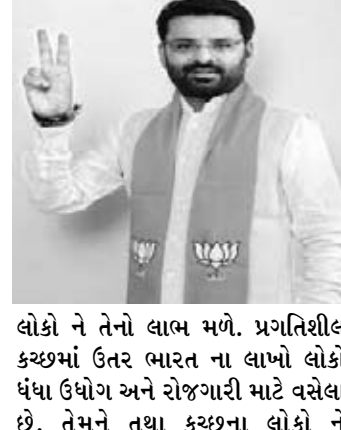
ભુજ, કચ્છ થી હરિદ્વાર માટે સામાહિક ટ્રેનની જાહેરાત રેલ્વે મંત્રાલયમ તરફ થી થઈ છે. જેને આવકારતા કચ્છ ના સાંસદ અને પ્રદેશ ભાજપ માહામંત્રી શ્રી વિનોદભાઈ યાવડાએ લોક સભા સભા દરમ્યાન રેલ્વે મિનિસ્ટર પાસે ભુજ થી દિલ્હી ટ્રેનિક વંદે માતરમ ટ્રેન સેવા શરૂ થાય અને તેના કનેક્ટિવિટી ટાઈમ માં દિલ્હી થી હરિદ્વાર ટ્રેન સેવા થાય તો લાખો લોકો ના માટે ફાયદાકારક છે.